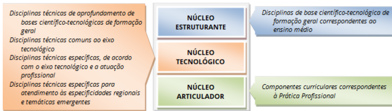
Figura 2 – Representação gráfica do desenho curricular dos cursos técnicos integrados “regulares” do IFRN.

A estrutura curricular proposta, contempla, em seu conjunto: disciplinas de formação geral, disciplinas de formação técnica, componentes curriculares correspondentes à Prática Profissional e, ainda mais, a Jornada de Integração Acadêmica. Estando articuladas, entre si, e alinhadas ao perfil profissional de conclusão do curso, essa proposição enseja uma formação integrada que articule ciência, trabalho, cultura e tecnologia e conhecimentos teórico-práticos do eixo tecnológico e da habilitação específica, contribuindo para uma sólida formação técnico-humanística dos/as estudantes.